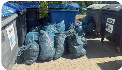
Einladung für streunendes Getier.