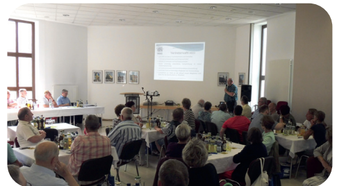
Veranstaltungsraum des St. Barbara-Hauses