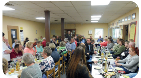
Rege Diskussion unserer Vertreter.