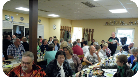
Volles Haus im Veranstaltungsraum.

waren ebenfalls anwesend und konnten so den anwesenden Vertretern Rede und Antwort stehen.